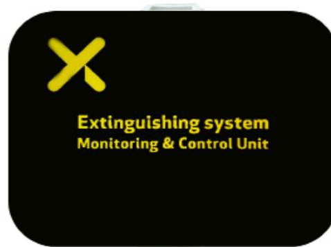
AF-X Monitor & Control Unit